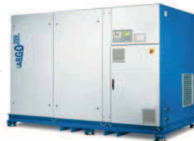
LARGO 200-400 standard kompresszor