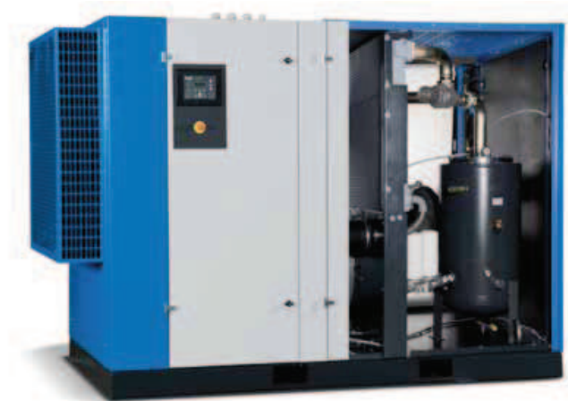
LARGO 11–55 plus kivitel beépített száritóval LARGO 315–400 vízhűtéses kivitel

Robusztus alkatrészek, ipari használatra tervezve.