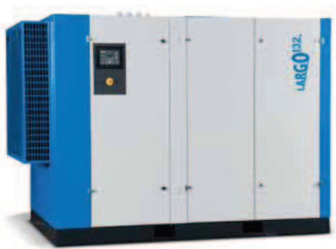
LARGO 11-160 standard kompresszor

... LARGO 11-55 beépített hűtveszárítóval